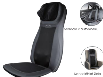
Sedadlo v automobilu

Masážní uzly jsou navrženy tak, aby imitovaly lidské ruce hnětící velké oblasti lidského těla. Dva páry hnětících uzlů budou klouzat nahoru a dolů po volném těle. Přístroj má tři masážní režimy: masáž celých zad, bederní částí zad a horní částí zad.